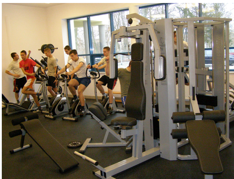
Zdjęcie 2. Siłownia