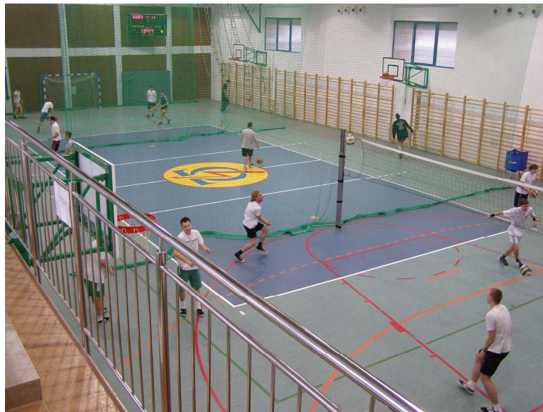
Zdjęcie 1. Hala sportowa